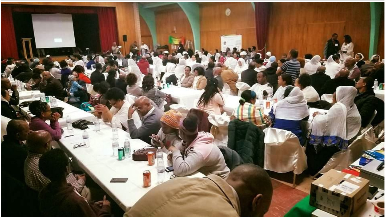
በህንጻ ግንባታ አስተባባሪ የህዝብ ግንኙነት ንዑስ ኮሚቴ በየሶስት ወሩ የሚዘጋጅ መፅሔት 6ኛ እትም ሚያዝያ 2010 ዓ/ም