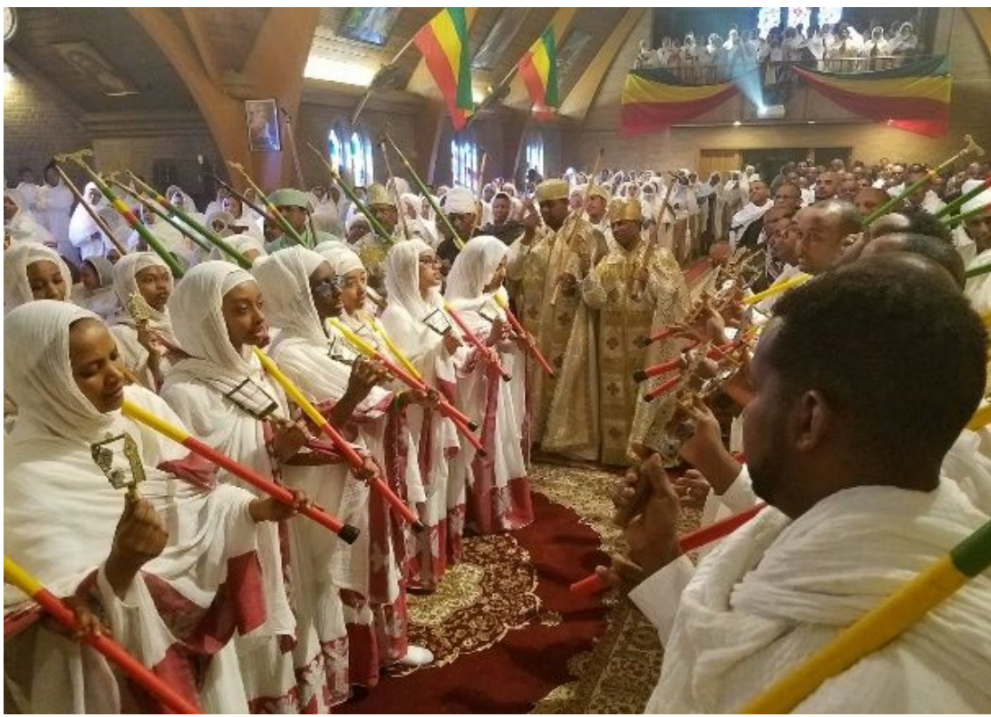
በህንጻ ግንባታ አስተባባሪ የህዝብ ግንኙነት ንዑስ ኮሚቴ በየሶስት ወሩ የሚዘጋጅ መፅሔት 6ኛ እትም ሚያዝያ 2010 ዓ/ም

ስብሐት ለእግዚአብሔር ወለወላዲቱ ድንግል ወለመስቀሉ ክቡር፤አሜን።