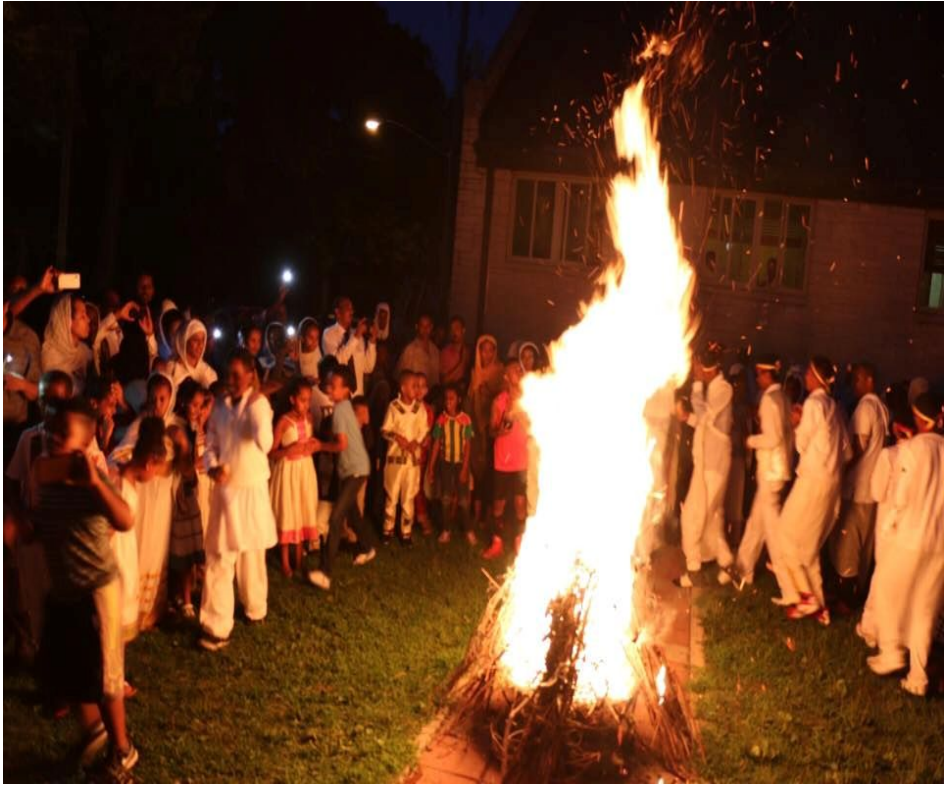
የቡሄ (የደብረ ታቦር) በዓል በመድኃኔዓለም ቤተክርስቲያን ሲከበር

ሆያ ሆዬ ሆ! የቡሄ ብርሃን ለእኛ መጣልን ክፈትልን በሩን የመድኃኔዓለምን ዓመት ዓውደ ዓመት ድገምና ዓመት! ድገምና እንዲሁ እንዳለን አይለዩን ሀብረታችን በዝቶ ሆ! ጥረታችን ሰፈቶ ሆ! ሃሳባችን ሞልቶ ሆ! ዳግም እንገናኝ ሆ! ሕንጻችን ተሰርቶ ሆ! ክበር በሥራ ክበር በዕምነት የመድኃኔዓለም ቤት!!